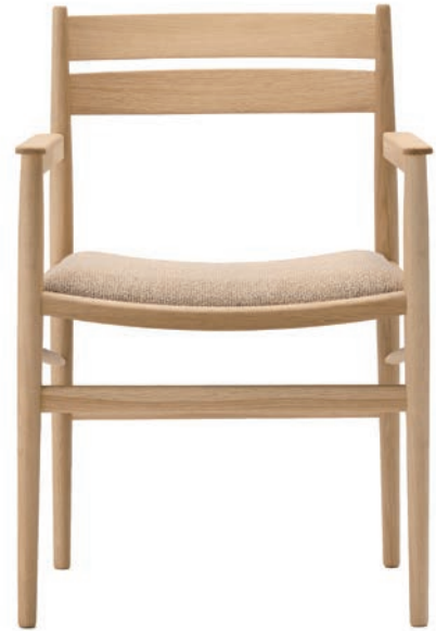
N-DC04 Dining Chair

DESIGN: Norm Architects CASE: Hiroo Residence