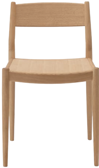
N-DC03 Dining Chair

DESIGN: Norm Architects CASE: Minatomirai Cafe