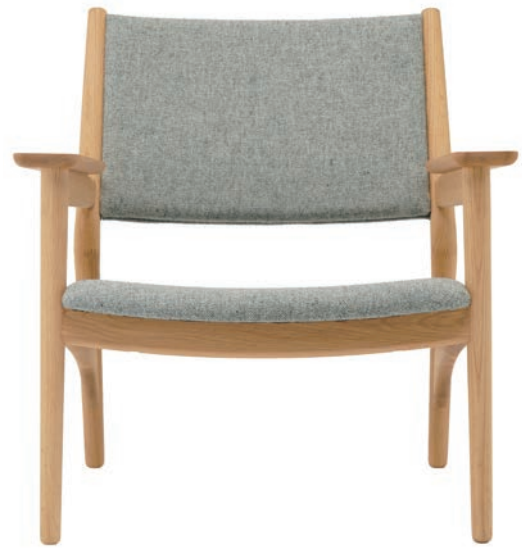
N-LC01 Lounge Chair

DESIGN: Norm Architects CASE: Kinuta Terrace