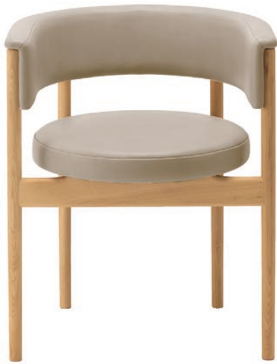
N-SC01 Side Chair

DESIGN: Norm Architects CASE: Minatomirai Cafe