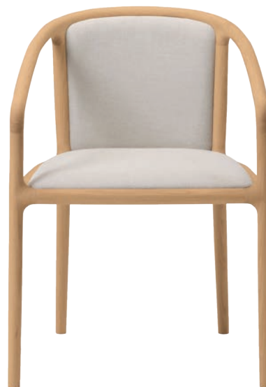
NF-DC01 Dining Chair

DESIGN: Norman Foster CASE: Residential Project