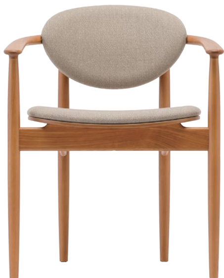
A-DC04 Dining Chair